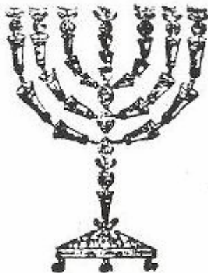
ציור המנורה שנדפס בפירוש המשנה לרמב"ם (סוף מסכת מנחות)

וטפח שבו היה גביע כפתור ופרח - יש תימה למה היה משונה משאר גביעים כפתורים ופרחים שהיה לכל אחד טפח ולג' אלו לא היה כי אם טפח, מ"ר.