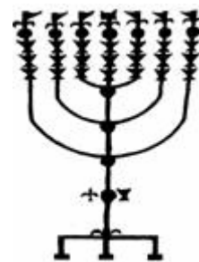
כת"י פרמה דה-רוסטי 1380 תמונה זו לקוחה ממקראות גדולת "הכתר" (שמ', חלק ב) בהוצאת אוניברסיטת בר-אילן, עמ' 196 בפ"י רש"י